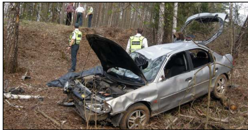
Eismo įvykio metu žuvo vairuotojo brolis

li bei sukėlęs eismo įvykį, kurio metu žuvo jo brolis, dar kaltinamas ir dėl to, kad pasišalino iš padaryto eismo įvykio. Tyrimo metu buvo nu-