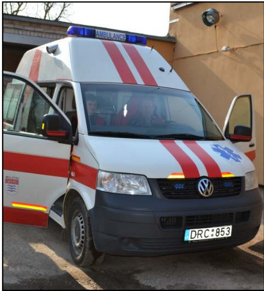
Molėtų greitosios medicinos pagalbos automobilis per vieną budėjimą įveikia 500 - 600 kilometrų

maliai žino. Pačios direktorės budėjimo metu teko suteikti pagalbą vienoje kaimo turizmo sodyboje į nelaimę patekusiam vokiečiui, kuris ke-