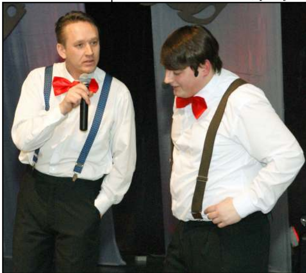
Kovo 8 - osios šventei ruošiasi itin kruopščiai