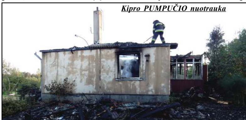
Giedraičių s. ugnis stipriai suniokojo gyvenamąjį namą