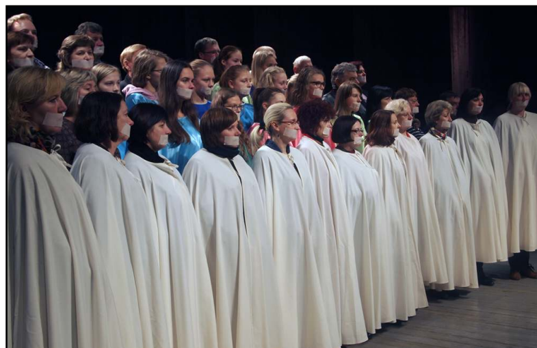
"Tylusis" koncertas buvo suorganizuotas ir Molėtų kultūros centre