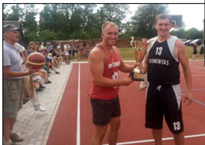
Visose varžybose nugalėtojas būna vienas, tad krepšinio taurė atiteko kiementiškiams

metimų, nei pražangų ar gražių perdavimų. 27:23 pergalę savo žiūrovams padovanojo turnyro šeimininkai inturkiškiai. Kitos rungtynės vyko nemažiau atkakliai - tik po pergalingo metimo paskutinę sekundę