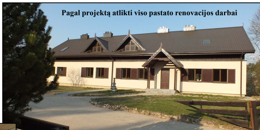
Pagal projektą atlikti viso pastato renovacijos darbai