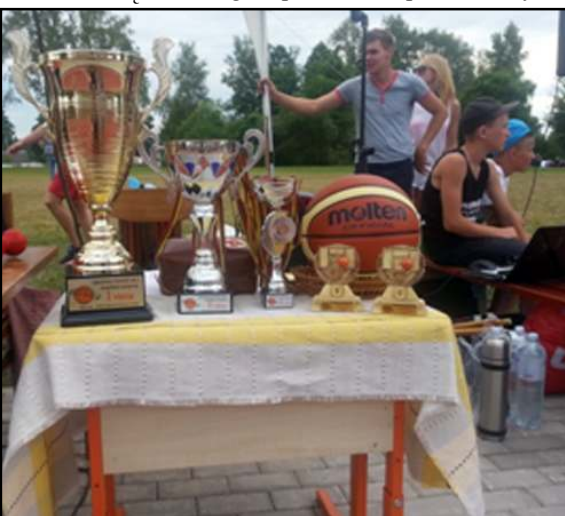
Rėmėjų dėka sportininkų laukė taurės, prizai ir išradingos vaišės

Joniškio komanda be pergalės paliko Inturkės veteranus, kuriuos susirinkę žiū-