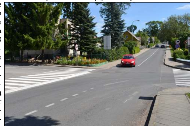
Molėtų miesto sankryžose ženkliai padaugėjo perėjų