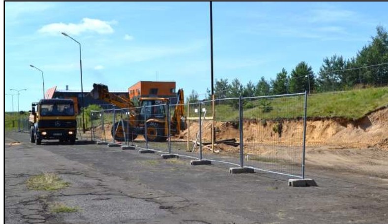
Miesto stadione dabar darbuojasi molėtiškė "Lakaja", kuriai patikėti subrangos darbai

atlikta darbų už 1,5 mln. litų, - informavo Molėtų rajono savivaldybės Statybos ir vietinio ūkio skyriaus ve-