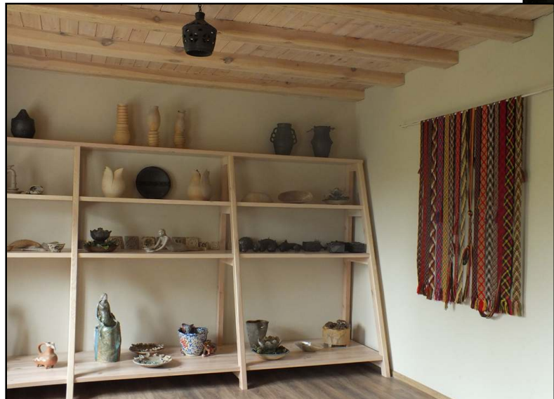
Pamažu savo vietą atnaujintame pastate atranda įvairūs meno dirbiniai,

diciniais lietuvių liaudies amatais ir menu, skatinti bendravimą ir bendradarbiavimą tarp kitų bendruomenių ir institucijų, inicijuoti kūrybines akcijas bei renginius, telkiančius vietos bendruomenę, kraštiečius. Susikūrus bendruomenei, kuri šiuo metu vienija per 30 aktyvių narių, atsirado poreikis turėti renovuotas patalpas ne tik burtis, bet ir įvairioms veikloms vykdyti. Tad