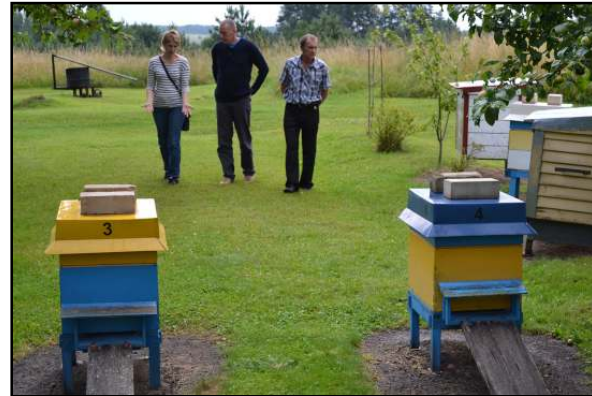
Smagūs bitininkų susijimai vasarą dažnesni