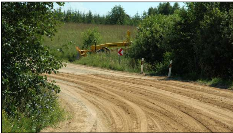
Purvėnų kelias kol kas tik asfaltuojamas, asfalto dangos artimiausiu metu neverta tikėtis

atkarpos remontuojamos ir žvyru kelyje Alantai - Laičiai - Paraisčiai -