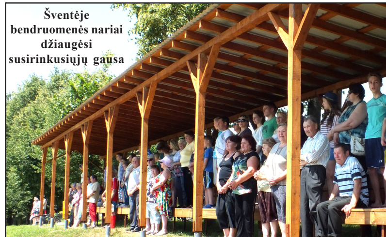
Šventėje bendruomenės nariai džiaugėsi susirinkusiųjų gausa