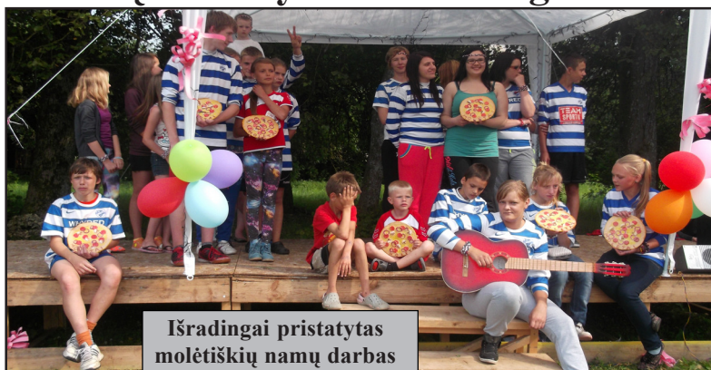
Išradinčiai pristatytas molėtiškių namų darbas

Beveik šimtą šeimų vienijanti Molėtų gausių šeimų bendrija "Šeimynėlė" šiemet ypač šauniai pasirodė tradiciniame bendrųjų sąskrydyje, surengtame Panevėžio