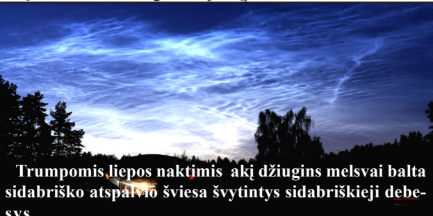
Trumpomis liepos naktimis akį džiugins melsvai balta sidabriško atspalvio šviesa švytintys sidabriškieji debesys

Trumpomis liepos naktimis ir toliau akį džiugins melsvai balta sidabriško atspalvio šviesa švytintys sidabriškieji debesys. Juos galima pamatyti šiaurinėje dangaus pusėje, kai Saulė iš po horizonto apšviečia aukštai atmosferoje tyrančias smulkias daleles, kurios ir sušvinta sidabriška melsvai balta šviesa. Tai labai aukšti debesys, susidarantys mezosferoje, maždaug 80-90 km aukštyje, kur šaltis siekia iki -120 C. Nors yra daug teorijų, aiškinančių šių debesų kilmę, tačiau kol kas iki galo jų kilmė vis dar lieka neaiški.