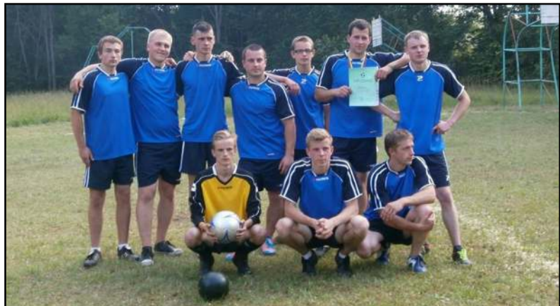
Turnyras dovanojo daug gražių sportinių akimirkų ir suteikė galimybių pabendrauti kaimynams