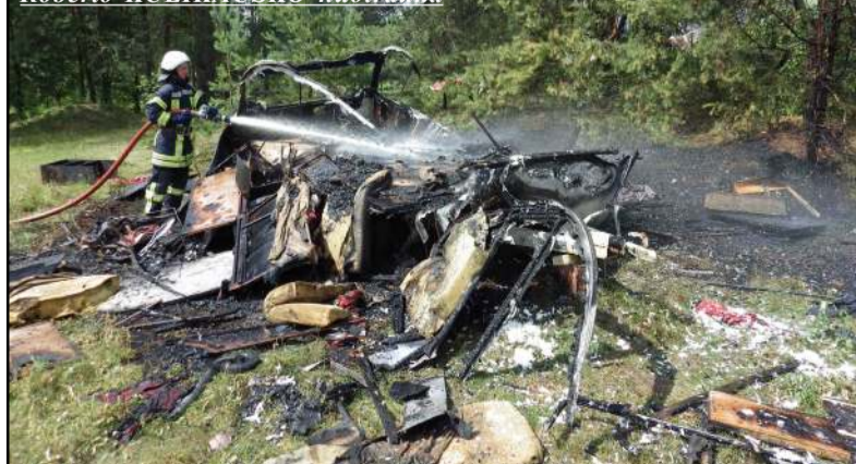
Užsidegus transporto priemonei - nuostoliai neišvengiami