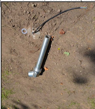
...šviestuvai išrauti su šaknimis...