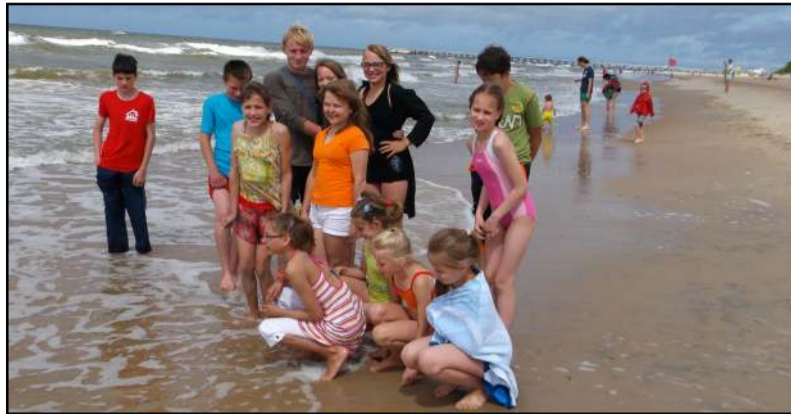
Kai kurie vaikai prie jūros buvo pirmą kartą

Liepos pradžioje Molėtų vaikų savarankiško gyvenimo namų 3 ir 4 šeimynų ugdytiniai, lydimi socialinių pedagogų keletą dienų praleido Palangoje (daugelis vaikų jūrą matė pirmą kartą). Ugdytiniai ne tik statė smėlio piliis, mėgavosi jūros bangomis, kūrė smėlio paveikslus, važinėjo išpūdingais keturračiais, smaguriavo įvairiais skanėstais, pramogavo HBH turizmo komplekse, bet aplankė ir Botanikos parką, pasigrožėjo gėlynais, tvenkiniais, užkopė ant Birutės kalno, užsuko į Švč. M. Marijos ėmimo į dangų bažnyčią, kur pasimeldė už save ir savo artimuosius, užsuko ir į gintaro dirbtuves, kuriose meistras pademonstravo gintaro apdirbimo technologiją. Apilankyta ir zoologijos sode - insektariume, kuris senesniai įsikūrė Palangoje ir yra vienintelis specializuotas nariuotakojų zoologijos sodas Lietuvoje. Saulėlydis stebėtas nuo Palangos tilto... Keturių dienų prabėgo akimirksniu, jos paliko neišdildomų išpūdžių ir malonių prisiminimų.