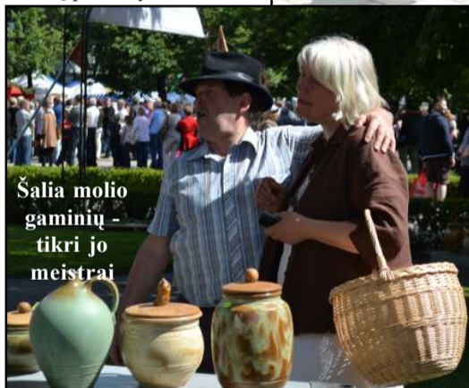
Šalia molio gaminių - tikri jo meistrai