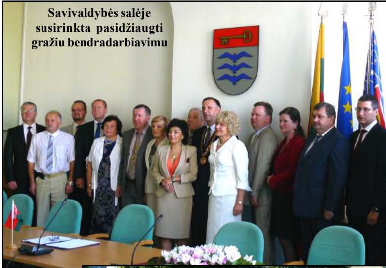
Savivaldybės salėje susirinkta pasidžiaugti gražiu bendradarbiavimu