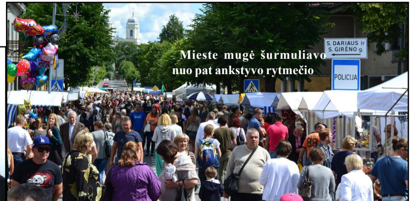
Mieste mugė šurmuliavo nuo pat ankstyvo rytmečio