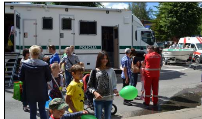
Vilniaus apskrities vyriausiojo policijos komisariato mobili vadavietė - vienintelis toks automobilis Baltijos šalyse

mento pareigūnai demonstravo mobilią radiacinės kontrolės įrangą, molėtiškiai kariškiai - ginklus ir kitą amuniciją. Čia pat šaudyta į taikinį, apžiūrė-