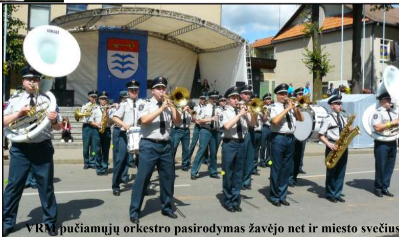
VRM pučiamųjų orkestro pasirodymas žavėjo net ir miesto svečius

mentu pareigūnai demonstravo mobilią radiacinės kontrolės įrangą, molėtiškiai kariškiai - ginklus ir kitą amuniciją. Čia pat šaudyta į taikinį, apžiūrė-