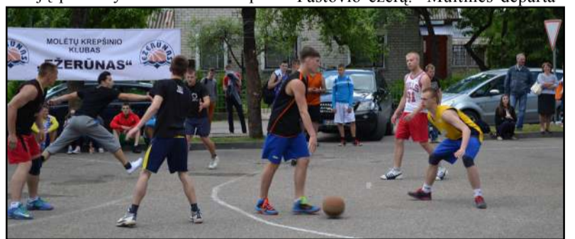
"Ežerūno" krepšinio aikštelėje kovos vyko visą dieną