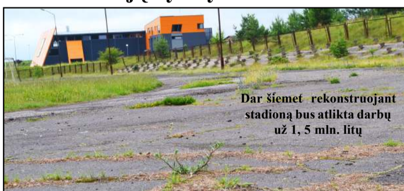
Dar šiemet rekonstruojant stadioną bus atlikta darbų už 1, 5 mln. litų

tybės investicijų programos bei Molėtų rajono savivaldybės lėšų. Pasak R. Pranskus, šiemet turi būti įrengti teniso kortai ir Padel aikštynas bei atlikta dalis kitų parengiamųjų darbų... "Vilnius" informacija