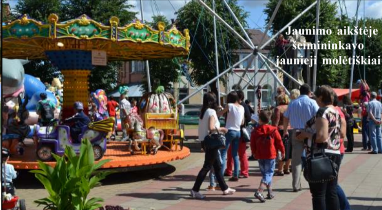
Jaunimo aikštėje seimininkavo jaunieji molėtiškiai