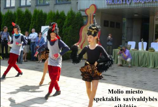
Molio miesto spektaklis savivaldybės aikštėje