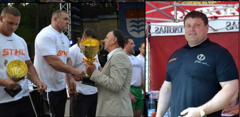
Nugalėtojus apdovanojo rajono meras ir čempionato teisėjas Ž. Savickas