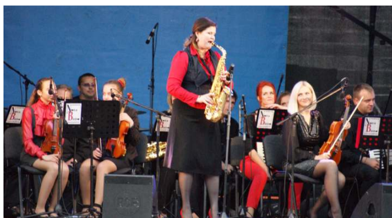
Vasaros estradoje koncertinį pasirodymą pradėjo svečiai - Gardino muzikos mokyklos estradinis simfoninis orkestras "Nota band"