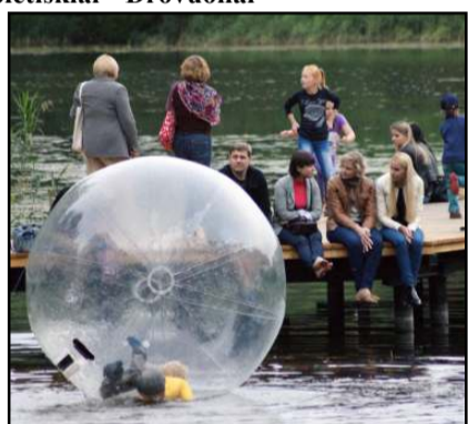
Vasaros estradoje - pramogos vaikams

programą pristatė Slonimo muzikinis ansamblis "Vizavi", o muzikinio vakaro vinimi tapo ir daugiausiai ovacijų sulaukė molėtiškiai "Drovuoliai", kuriems be didesnių pastangų pavyko išjudinti publiką sutinkant grupę "Lemon Joy". Vidurnaktį nugriaudėjo šventinis fejerverkas, o antroji šventės diena vainikuota diskoteka... Sekmadienį Molėtų šv. apašt. Petro ir Povilo bažnyčioje tikinčiuosius, jaunimą, paraprijos dvasininkus su bažnyčios titulo švente svei-