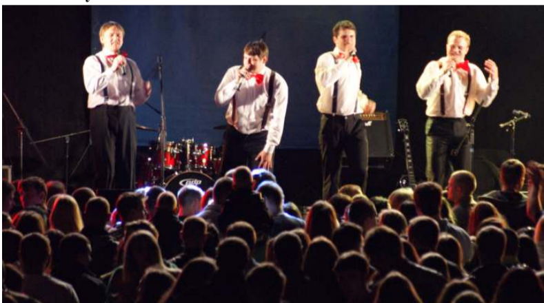
Daugiausiai ovacijų sulaukė molėtiškiai "Drovuoliai"

programą pristatė Slonimo muzikinis ansamblis "Vizavi", o muzikinio vakaro vinimi tapo ir daugiausiai ovacijų sulaukė molėtiškiai "Drovuoliai", kuriems be didesnių pastangų pavyko išjudinti publiką sutinkant grupę "Lemon Joy". Vidurnaktį nugriaudėjo šventinis fejerverkas, o antroji šventės diena vainikuota diskoteka... Sekmadienį Molėtų šv. apašt. Petro ir Povilo bažnyčioje tikinčiuosius, jaunimą, paraprijos dvasininkus su bažnyčios titulo švente svei-