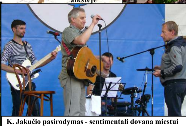
K. Jakučio pasirodymas - sentimentali dovana miestui