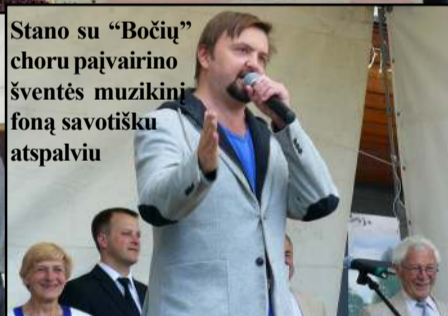
Stano su "Bočių" choru pajavairino šventės muzikinį foną savotišku atspalviu

kvietęs visus susipažinti su mieste vykšančiu unikaliu spektakliu, kurį pradėjo žavūs žali varliukai. Jiems talkino solidus vištomis bei gaidžiais apsirėdžusių šokėjų pasirodymas. Užsukta ir pas