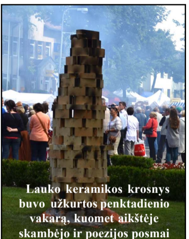
Lauko keramikos krosnis buvo užkurtos penktadienio vakarą, kuomet aikštėje skambėjo ir poezijos posmai