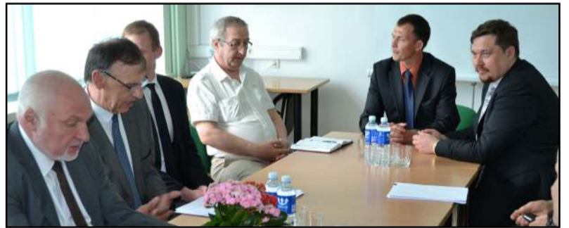
Svečiams reikėjo konstruktyvios diskusijos, tokia ji ir buvo, rezultatas - pluoštas pasiūlymų bus pateikta raštu

KLUBE UTENOJE. Į policiją kreipėsi molėtiškis (g.m. 1995), pranešdamas, kad šeštadienį apie 2.40 val. klube, esančiame Utenoje, jam nepažįstamas vaikinys sudavė kumščiu į galvą. Įtariamasis - neblaivus (2,89 prom.) uteniškis sulaikytas ir uždarytas į areštinę.