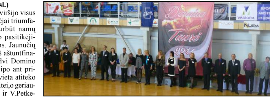
Varžyboms teisėjavo 24 teisėjai iš visos šalies