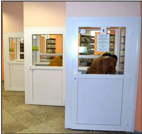
Molėtų PSPC registratūroje penktadienio rytmetį desnis specialistų

-Manau, kad teisę spręsti, ar rajono politikai priėmė teisingą sprendimą, šiandien turi pacientai. Kiekviena įstaiga turi savų pliusų ir minusų. Pavyzdžiui, maža yra geresnė tuo, kad pacientas greičiau orientuojasi, kur minimalioje erdvėje jam kreiptis. Pripažinkime, kad Šeimos sveikatos centre buvo patogiau ir kompaktiškiau jauniems, skubantiems pacientams. Tuo tarpu dabartinė turima didelė įstaiga taipogi turi privalumų - didesnės ir patogesnės erdvės, sumažintos išlaidos administravimui, didesnis specialistų kolektyvas teikia daugiau pasitikėjimo ir pan. Dabar mūsų pacientai siūlo iš trečio pastato aukšto į pirmąjį perkelti laboratoriją. Tai būtų patogiau vyresnio am-