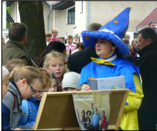
Klausimai apie Europą daug kam buvo lengvi

prieš dešimt gegužių gimę Molėtų pradinės mokyklos trečiokai, į orą paleidę mėlynos ir baltos spalvos balionus, o visai čia pat veikė eurokioskas, kur kartu su eurožiniukais buvo galima atsakyti į klausimus apie Europą, Molėtus, aišku, gauti prizų, buvo žaidžiamas žaidimas "Surask Europos šalį". Chorų festivalio metu pasirodė Molėtų menų mokyklos jaunučių, jaunių chorai, mišrus vokalinis ansamblis "M'Lux", Alantos gimnazijos, Molėtų pradinės mokyklos, Sugintų pagrindinės mokyklos chorai, Kultūros centro berniukų choras, Molėtų gimnazijos mišrus choras, o festivalį užbaigė Molėtų pagrindinės mokyklos vokalinis ansamblis.