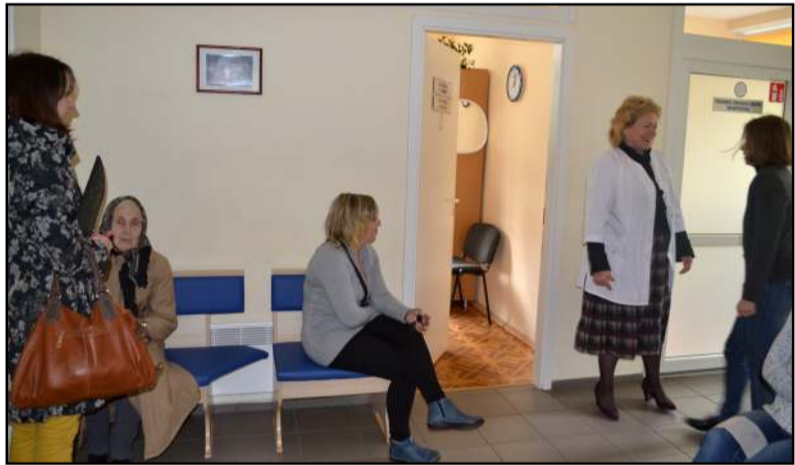
Psichikos sveikatos centras įrengtas taip, kad jo pacientai gautų visas paslaugas vienoje vietoje, specialistai turi galimybę vietoje pasitarti

Ziaus žmonėms, tiems, kurie turi negalią, mamoms su vaikais ir pan. Tad jau dabar bręsta sprendimas patenkinti ir tokį poreikį. Suprantama, jog tokius žingsnius lengviau padaryti didesnėje įstaigoje nei toje, kuri spaudžiasi turimose menkose valdose. Ar maža įstaiga gali išgelbėti didelę įstaigą? Bet kokių atveju tai buvo dvi viešosios įstaigos, kurių steigėjas bendras. Tik steigėjas priima sprendimus dėl strategijos, todėl manau, kad jie įstaigoje nediskutuotini, bet privalomi vykdyti.