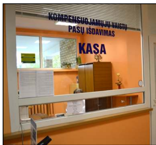
Kompensuojamų vaistų pasai pacientų patogumui išduodami ne ligoninėje, o PSPC patalpose

-Etatų mažinimas - papildomos išlaidos išeitinėms pašalpoms, kad su ilgus me-