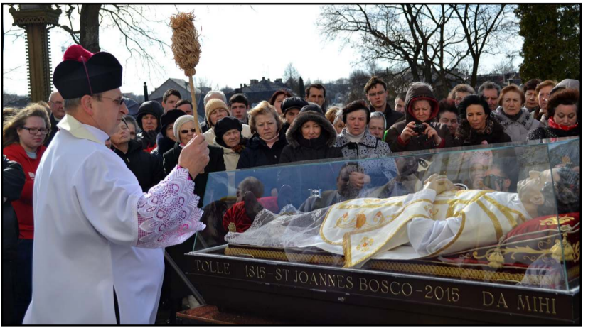
Gausus būrys molėtiškių ir dvasininkų iš Molėtų bei kitų dekanatų šv. Jono Bosko relikvijas pasitiko šventoriuje