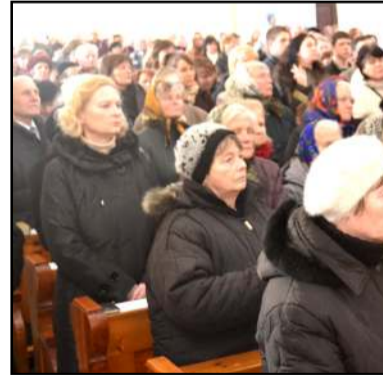
Tikintieji sakralumo valandą Molėtų bažnyčioje taipogi buvo kviečiami susimąstyti apie laisvę

sirinkus tikintiesiems, dalyvaujant Molėtų ir kitų dekanatų kunigams, Molėtų bažnyčios šventoriuje iškilmingai buvo pasitiktos šventojo Jono Bosko relikvijos. Stiklinę urną atgabenus į bažnyčią, prieš pra-