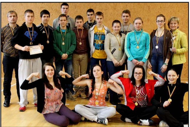
Abiejų Molėtų komandų nuotaika buvo puiki