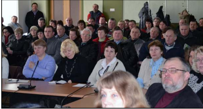
Pasitarimas sulaukė itin didelio žemdirbių dėmesio

mui, dalis lėšų turi būti skiriama tęstiniam išipareigojimams, 6 proc. programos lėšų privalu "įšaldyti" kaip rezervą ir t.t. Nacionalinę gyvulininkystės sektoriaus plėtros 2014 - 2020 m. programą pristatė ŽŪM Žemės ūkio gamybos ir maisto pramonės departamento Gyvulininkystės skyriaus vedėjas pava-