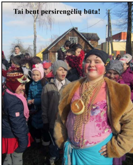
Tai bent persirengėlių būta!