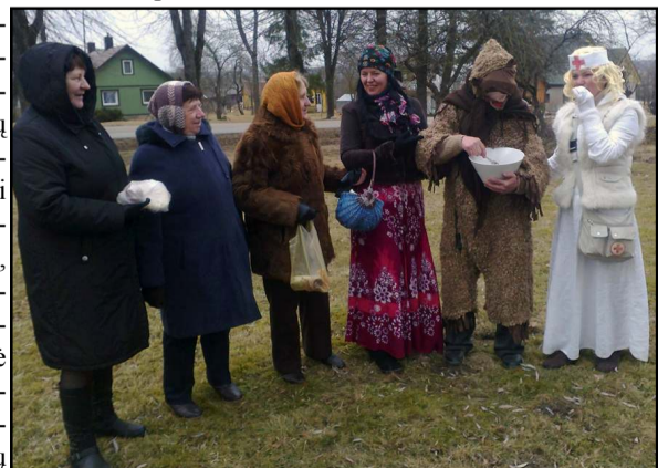
Persirengėlių nestigo ir Videniškiuose

skonių blynų. Vaišintasi karšta arbata. Džiugu, kad Užgavėnių šventė miestelio gyventojus suvienijo prie bendro stalo parapijos namuose.