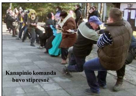
Kanapinio komanda buvo stipresnė

Prenumeruokite savo krašto laikraštį "Vilnis"!