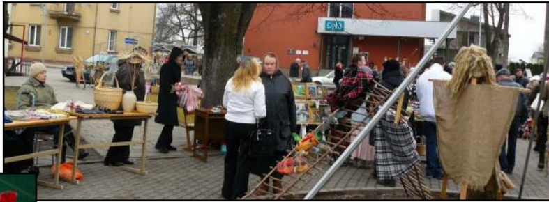
Nepaisant to, kad visuose rajono pakraščiuose tą dieną vyko šventės, visgi ir miesto centre sulauktas gausus prekiautojų būrys

Šios mugės akcentas - tai Molėtų rajono neigaliųjų organizacijų rankdarbiai, kurių nestigo ant prekystalių. Sa-