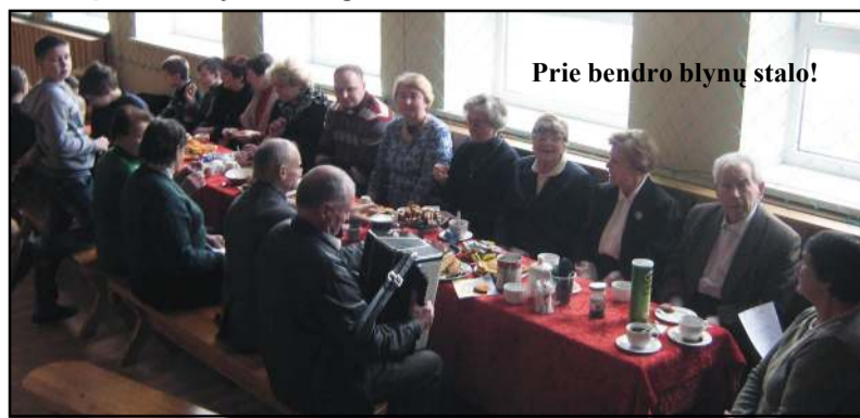
Prie bendro blynų stalo!

šnekėti ir užsigavėti. Prie gausaus tądien žmonėmis bei vaišėmis stalo