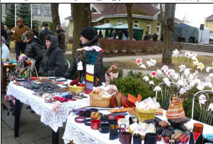
Molėtų krašto ŽNS narių, kurių, lankančių rankdarbių grupės užsiėmimus, vis daugėja, prekybinis stalas šiemet buvo dar ilgesnis...