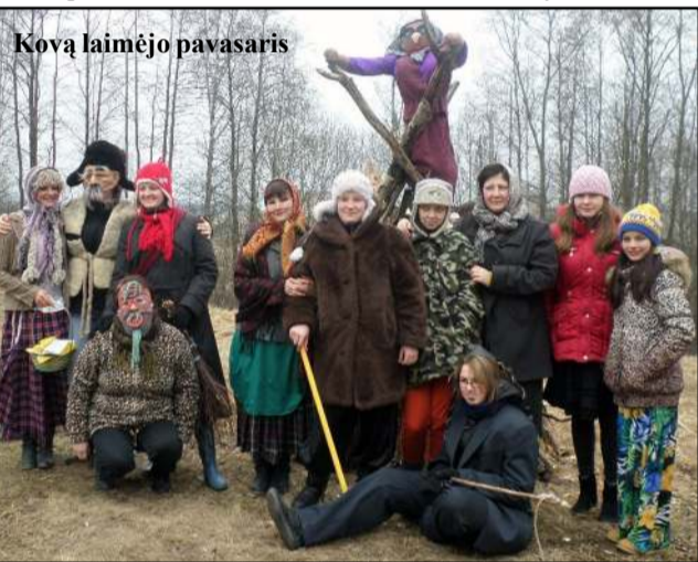
Kovą laimėjo pavasaris