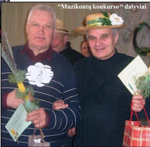
"Muzikantų konkurso" dalyviai