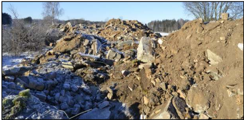
Drąsėnų kaime (Čiulėnų s.) suvežtos nugriautų pastatų atliekos bus smulkinamos atgabenus specialų agregatą