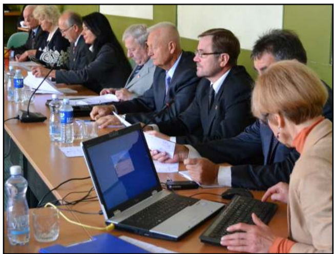
Daugiausia diskusijų posėdyje sulaukė Garbės piliečio vardo suteikimo nagrinėjimas

Praėjusių ketvirtadienį, pasak sinoptikų, žvarbiausią sausio dieną, įvyko pirmasis šiais metais rajono tarybos posėdis. Keletui rajono tarybos narių nedalyvaujant, posėdį stebinti vėlgi keletui molėtiškių prie