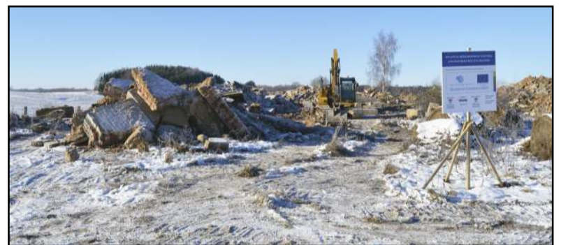
Iš viso jau nugriauta ir likviduota 12 bešeimininkių pastatų vivaldybininkas paminėjo, kad rangovas - UAB "Tvirta" jau likvidavo 12 apleistų, kraštovaizdį darkančių