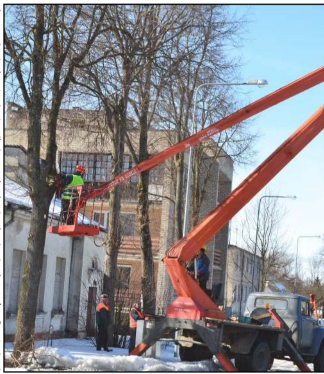
"Molėtų švaros" darbininkams dažnai talkina atliekantieji visuomenei naudingą veiklą

sak savivaldybės vyr. specialisto, suprantama, socialinių pašalpų gavėjai dirba kartu su UAB "Molėtų švara" darbininkais. "Labai didelis darbas padarytas nuženint medžius Vilniaus, Molėtų, Žaliosios gatvėse. S. Dariaus ir S. Girėno gatvėje palei sodų bendriją "Apynelis" medžių