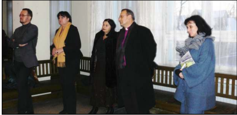
Parodos atidarymo metu žvelgta į sostinės šaligatvius