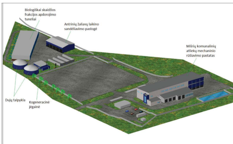
Mechaninio ir biologinio apdorojimo įrenginių pastatai Utenos regioniniame nepavojingų atliekų sąvartyne

Vykdamas projektą „Utenos regiono komunalinių atliekų tvarkymo sistemos plėtra“ Nr. VP3-3.2-AM-01-V-02-006, UAB „Utenos regiono atliekų tvarkymo centras“ su rangovu UAB „Manfula“ 2013 m. rugpjūčio 29 d. sudarė rangos sutartį „Utenos regiono komunalinių atliekų tvarkymo sistemos plėtra: mišrių komunalinių atliekų mechaninio ir biologinio apdorojimo įrenginių projektavimas, tiekimas ir statyba Utenoje“, kurios vertė – 16 505 500 litų be PVM. Sutarties vykdymo metu bus parengti komunalinių atliekų mechaninio rūšiavimo pastatų, statinių ir įrenginių bei visos bendros mechaninio biologinio apdorojimo įrenginių reikalingos infrastruktūros techniniai ir darbo projektai, pastatyti ir įrengti komunalinių atliekų mechaninio rūšiavimo įrenginiai, pastatai ir statiniai bei visa bendra mechaninio biologi-