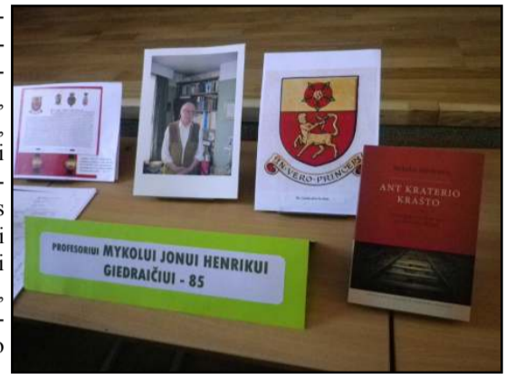
Mokykloje surengta parodėlė, skirta jubiliatui