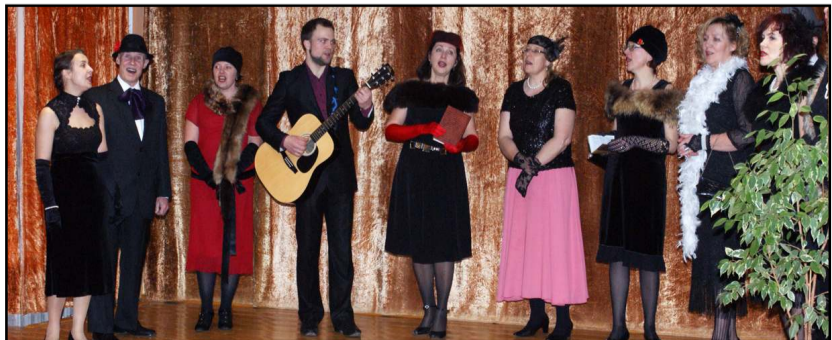
"Malkesta" atliko kaimo ir miesto romansus