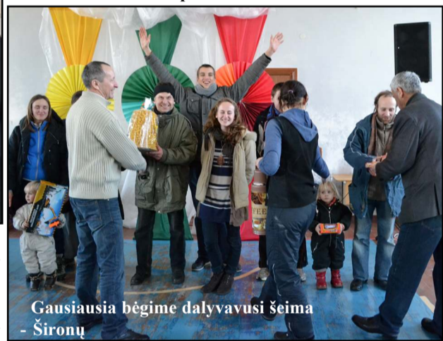
Gausiausia bėgime dalyvavusi šeima - Šironų

teatro studijos "Remarka" aktoriai, publiką nuo pat pirmųjų akordų "užvedė" grupė "Drovuoliai".