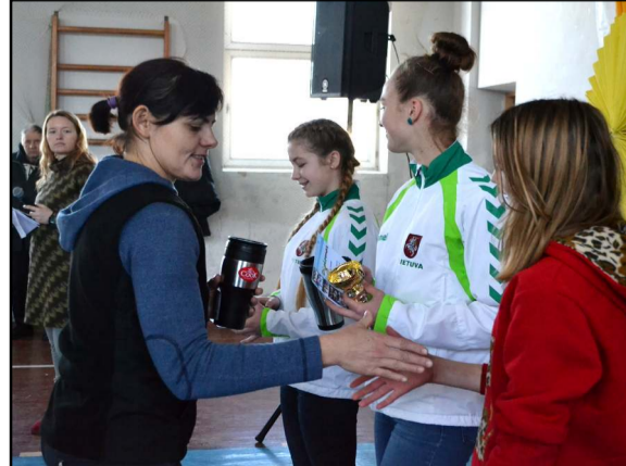
Ž. Kanapkienė teikė apdovanojimus

Kol buvo skaičiuojami rezultatai, koncertavo Kultūros centro kolektyvai - "Remarka" ir... O absoliučiais nugalėtojais 13 km distancijoje