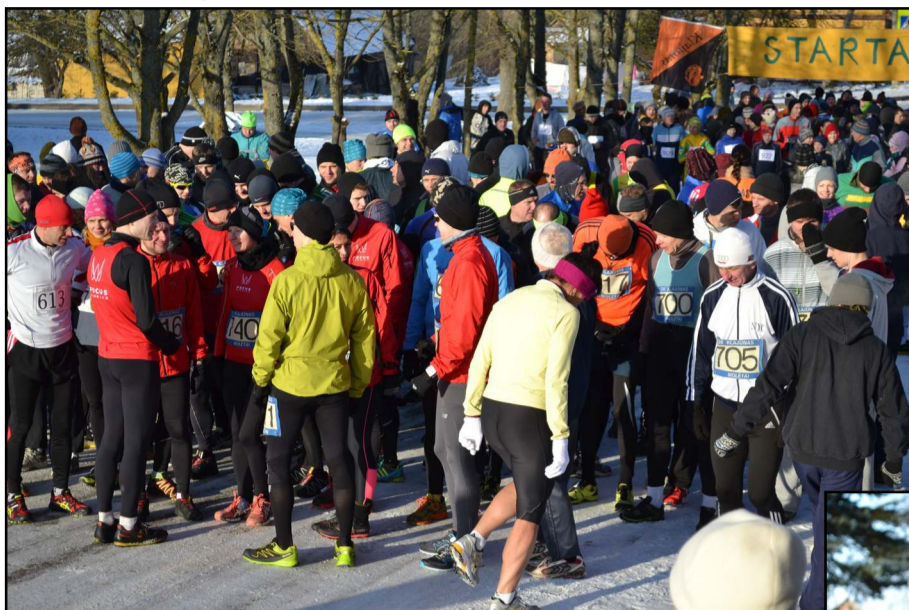
Bėgimui užsiregistravo beveik pusė tūkstančio norinčiųjų startuoti, dalyvavo šimtu mažiau

-Pirmą kartą dalyvauju bėgime, - šypsojosi prieš startą užkalbintas žinomas krepšininkas, įsikūręs Mo-