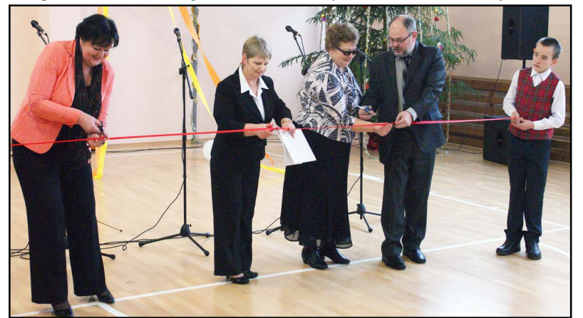
Iškilmingai perkirpta juosta - naujų veiklų Joniškyje pradžia

linio ugdymo paslaugomis, o jų tėvai galės sugrįžti į darbo rinką. Be to, suaugusiesiems bus sudarytos sąlygos savišvietai ir edukacijai, o mokyklinio amžiaus vaikai, jaunimas