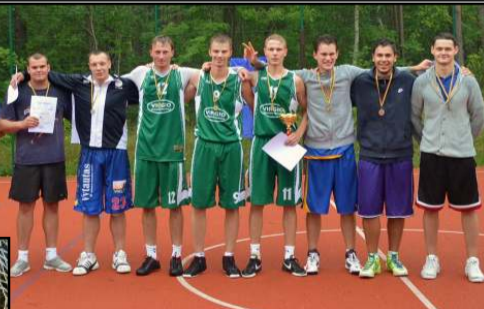
Krepšinyje laimėjo draugystė