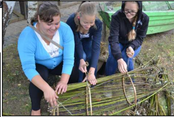
Merginos pasigyrė, kad turi gerą mokytoją, kuri išmokė bučiukus pinti