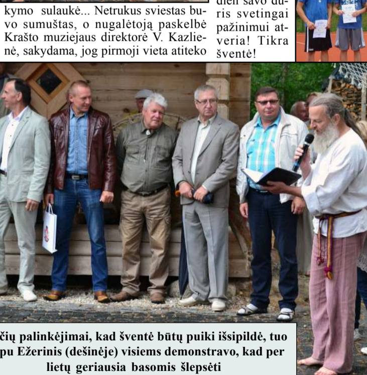
Svečių palinkėjimai, kad šventė būtų puiki išsipildė, tuo tarpu Ežerinis (dešinėje) visiems demonstravo, kad per lietų geriausia basomis šlepsėti