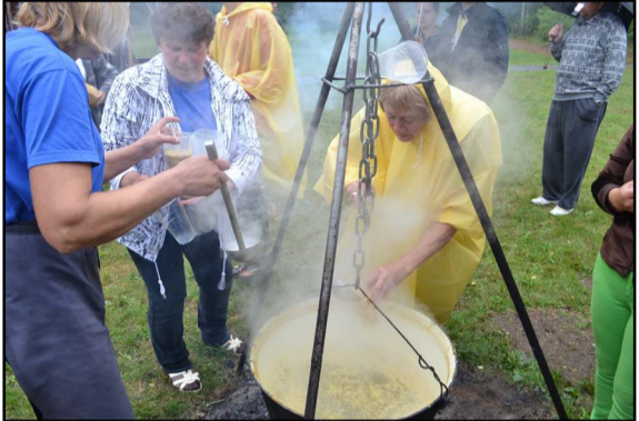
Mindūniškių žuvienei kol kas nėra lygių

mugėje dešrų, saldumynų, papuošalų, pažiūrėti, kaip merginos pina bučių... Kas norėjo, veiklos rado, kas lietaus nepabūgo, tas širdyje šventę pajuto. O kai susiburta unikalioms varžytuvėms - sviesto mušimo čempionatui, plūptelėjo ir emocijų, ir susižavėjimo banga. Na, ir mušė sviestą, na, ir prakaitavo moteriškes, mergaitės ir vienas vyriokas, pasirodo, seniūnės įkalbintas prie gausaus būrio moteriškių prisidėti. Davus startą, pastarasis net ir gausaus palai-