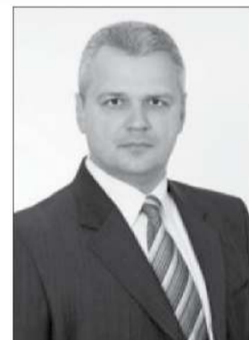
Žemės ūkio ministras Vigilijus Jukna.