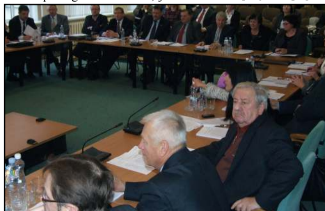
Beveik 40 - ties klausimų darbotvarkė "sumenko" labai greitai, atrodo, opozicijos balsas tapo ne toks girdimas