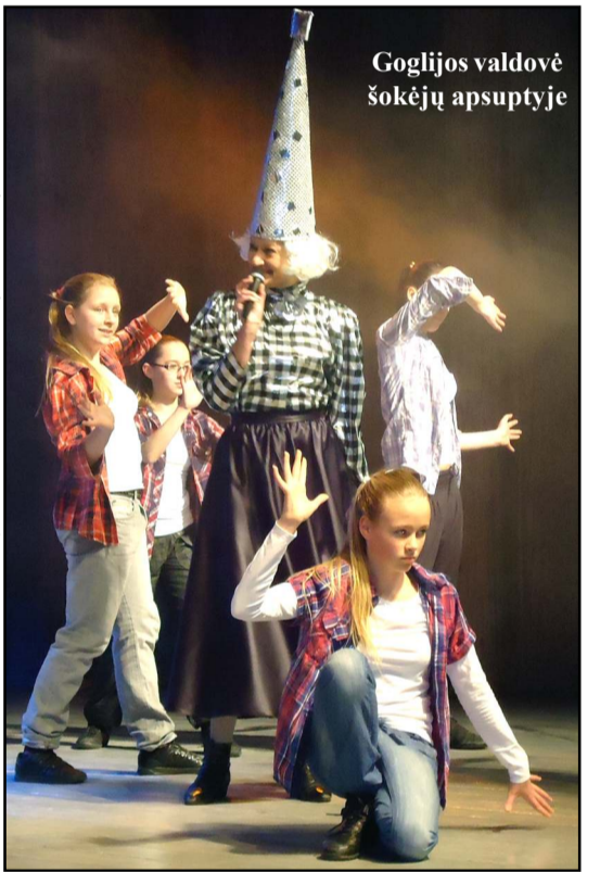
Goglijos valdovė šokėjų apsuptyje