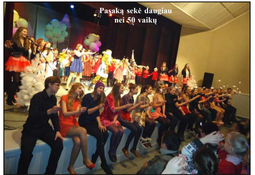
Pasaką sekė daugiau nei 50 vaikų

buklų šalį Živilė galiausiai suprato, kad ji pasiilgo mamos, tikrų jos apkabinimų, tikrų draugų. Valandos