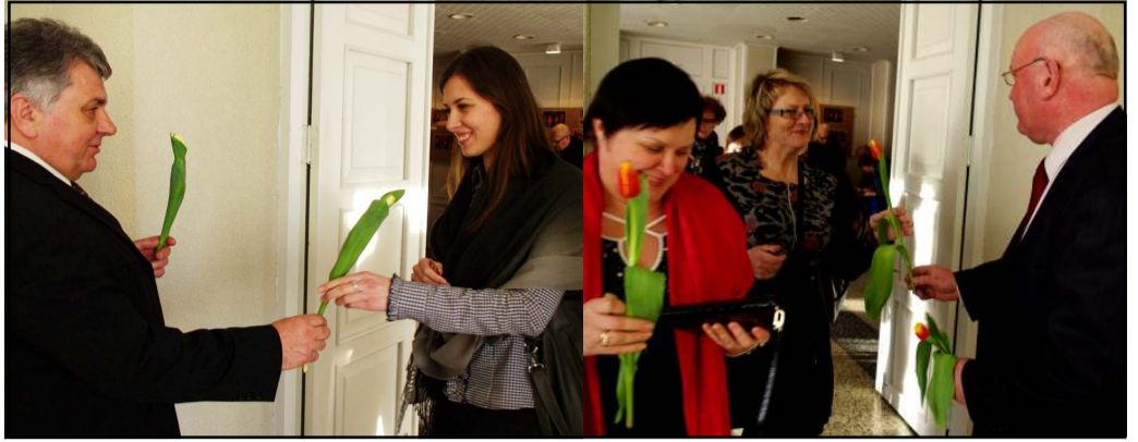
Pirmiausia moteris pradžiugino vyrų dovanojamas tulpės

Tarptautinės moters dienos proga į jau gražią tradiciją tampantį renginį - koncertą "Meilės vardu", skirtą moters dienai paminėti, visas Molėtų krašto moteris ir merginas pakvietė kūrybingi rajono vyrai. Ket-