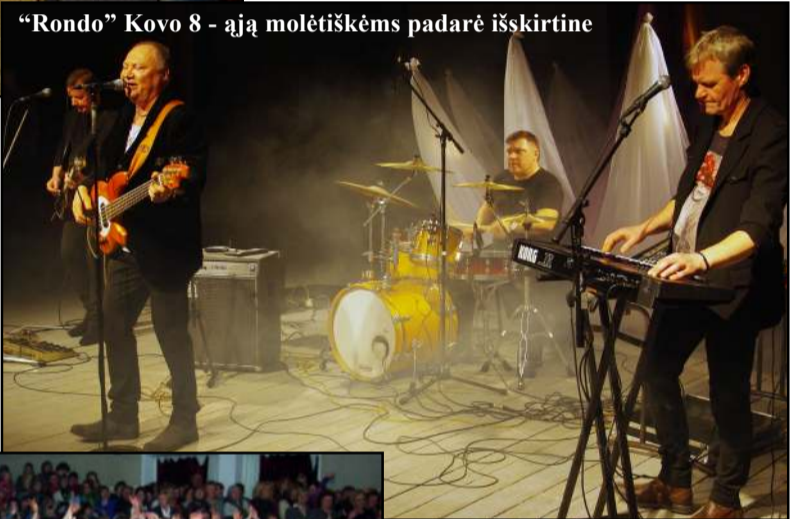
"Rondo" Kovo 8 - ają molėtiškėms padarė išskirtine