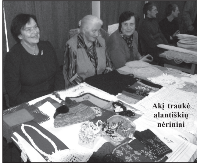
Akį traukė alantiškių nėriniai