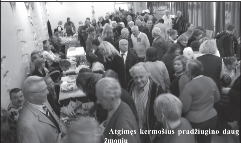
Atgimęs kermošius pradžiugino daug žmonių

-Visi paveikslai restauruoti, labai gražiai sutvarkyti, todėl tie, kurie juos matė anksčiau, dažnai ir neatpažįsta naujam gyvenimui atgimusių darbų. Paveikslai bus eksponuojami mokykloje, kad kiekvienas galėtų su jais susipažinti, - kalbėjo direktorė ir dėkojo visiems,