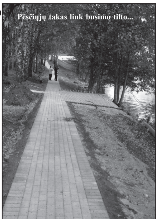
Pėsčiųjų takas link būsimo tilto...