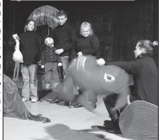
Kijėlių specialiojo ugdymo centro jaunieji aktorai kalbėjo meilės kalba...

žio, šviesos ieškojimas žmonėse. -Tad reikia džiaugtis gyvenimu, nors kartais jį apunkina negalios. Gyvenimas yra gražus, patikėkite (Nukelta į 7 psl.)