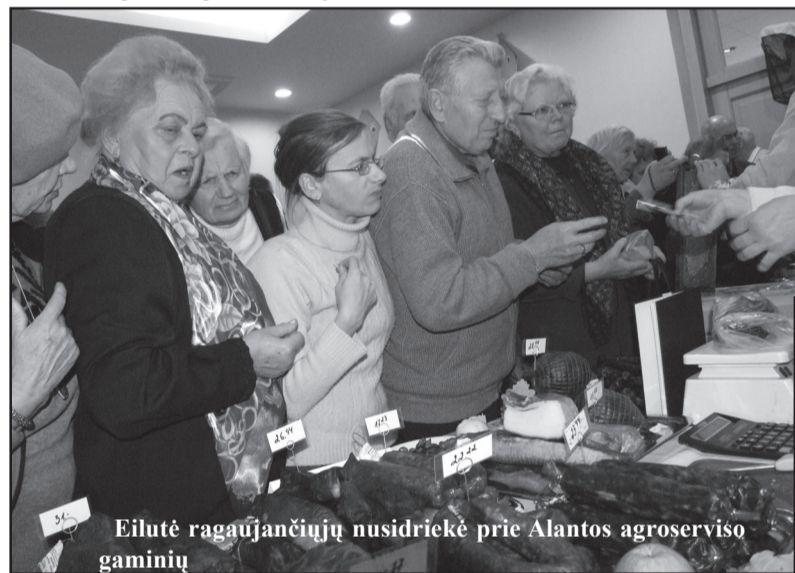
Eilutė ragaujančiųjų nusidriekė prie Alantos agroserviso gaminių