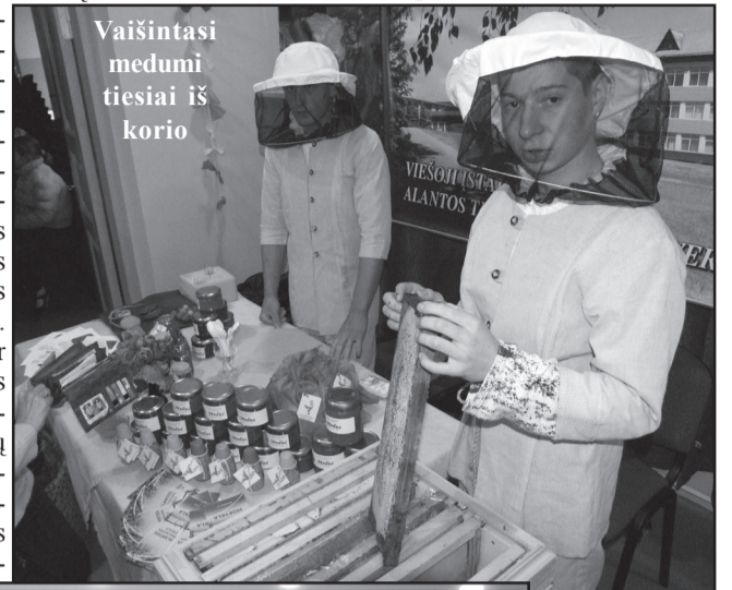
Vaišintasi medumi tiesiai iš korio