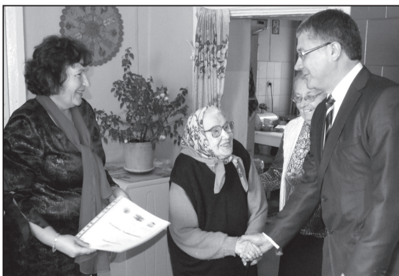
Molėtų garbės pilietė sveikino rajono merą ir vicemerę