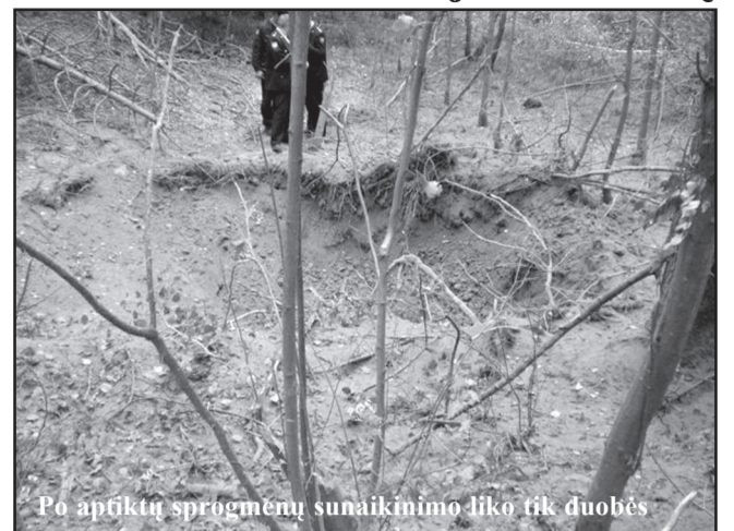
Po aptiktų sprogmenų sunaikinimo liko tik duobės

dienį. Juos miške po nedideliu žemės sluoksniu aptiko gry- bautojas. Atvykę iš- minuotojai juos sunai- kino vietoje. Kadangi tarp vietinių gyventojų buvo žino- ma apie miš- ke galimą II pasaulinio