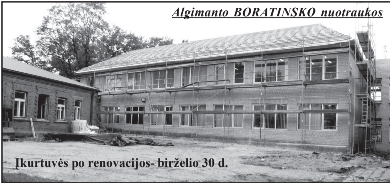
Įkurtuvės po renovacijos - birželio 30 d.

mokyklos korpuse, kur statybos vyksta, išnaudojamos visos laisvos erdvės. Tarkime, pirmadienį direktoriui išėjus vesti pamokas, jos kabi-