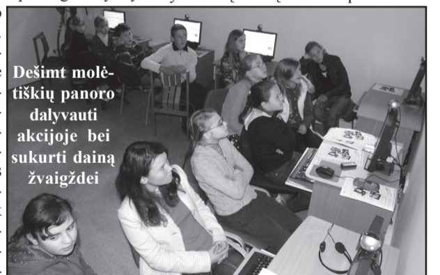
Dešimt molė- tiškių panoro dalyvauti akcijoje bei sukurti dainą žvaigždei

tys vaikai dainas kurs septyniems žinomiems atlikėjams. Atrinktų dai- nų autorių laukia prizai ir dovanos. Iš Molėtų bibliotekoje akcijoje da- lyvavusių vaikų dešimt panoro da- mą, į akciją buvo pakviesti vaikai.