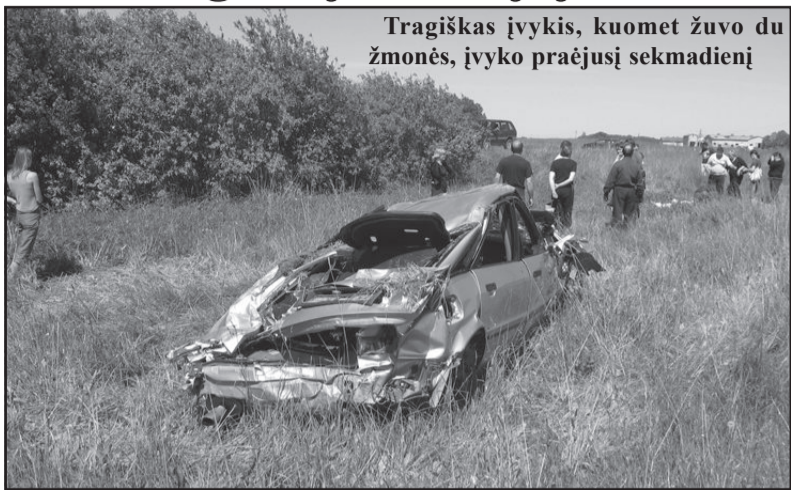
Tragiškas įvykis, kuomet žuvo du žmonės, įvyko praėjusį sekmadienį