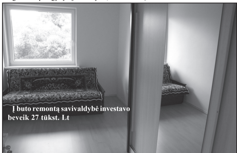
Į buto remontą savivaldybė investavo beveik 27 tūkst. Lt