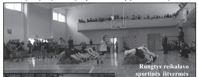
Rungtys reikalavo sportinės ištvėmės

Emocijų ir sportinio azarto tradiciškai nestokota ketvirtadienį Molėtų pagrindinės mokyklos sporto salėje vykusiose rajono mokinių olimpinio festivalio "Drąsūs, stiprūs, vikrūs" varžybose. 5 - 6 klasių grupėje šįmet panoro dalyvauti ir Molėtų pagrindinės mokyklos komanda, kuri varžėsi su jaunesnių varžovų komandomis - 3 - 4 klasių moksleivių iš Molėtų pradinės ir Alantos vidurinės mokyklų komandomis. Tarp pastarųjų mokyklų komandų ir vyko įdomi ir įtempta kova. Iš septyneto estafečių keturiose